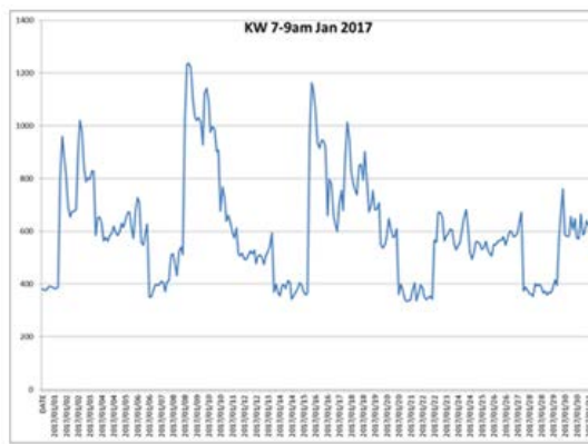
Profil B - Refusé